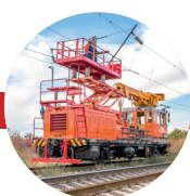
Trafik och transport