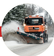
Drift och underhåll